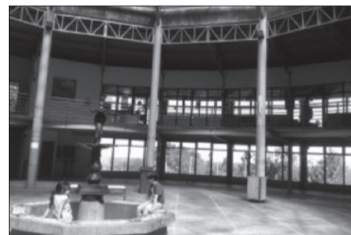
Mercado Presidente Ibáñez de Puerto Montt

La idea es que este grupo de ferias mode-