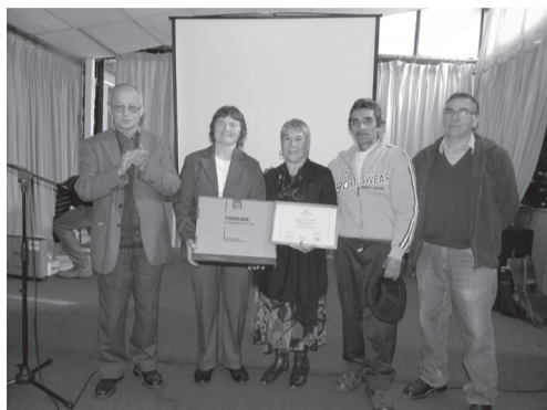
Primer lugar, Puente Alto.

Idea presentada: propuesta de Radio Mi Feria con batería solar, o recargable, que